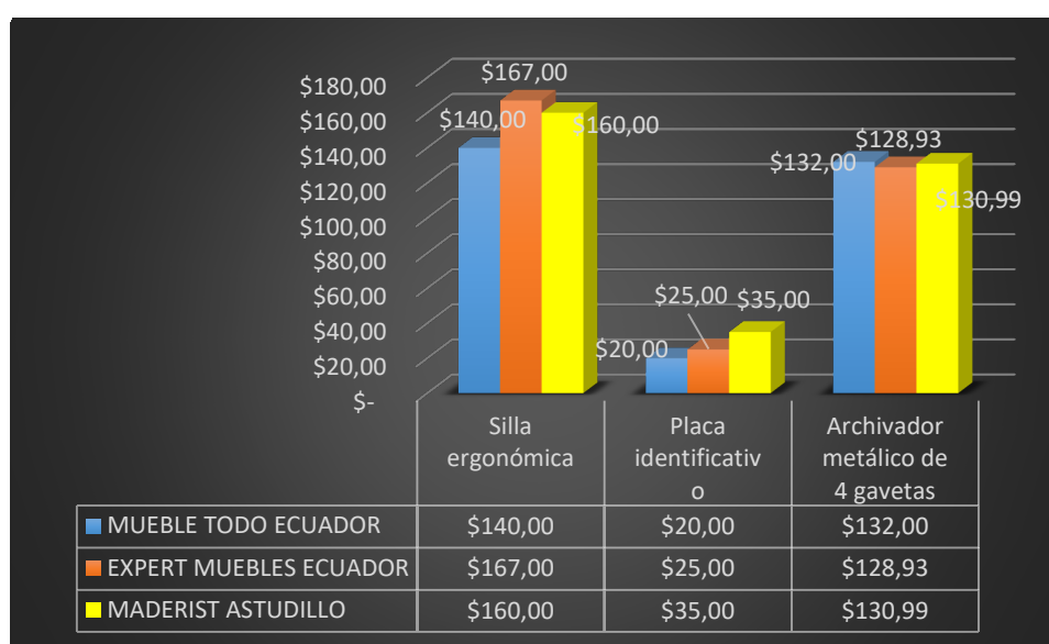
Grafico. 1 Estudio de mercado – Equipamiento Informático